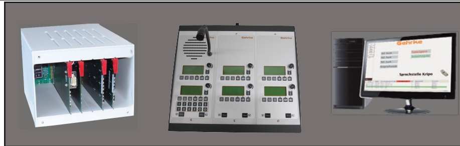
Sprachkommunikation Voice Communication

We have over 30 years of experience in the development of hardware and software and the production of voice communications systems.