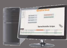
Visualisierungssysteme Visualization System