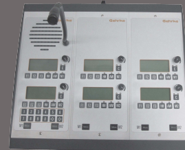
Überwachung und Steuerung Monitoring and Control