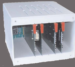
Sprachkommunikation Voice Communication

We have over 30 years of experience in the development of hardware and software and the production of voice communications systems.